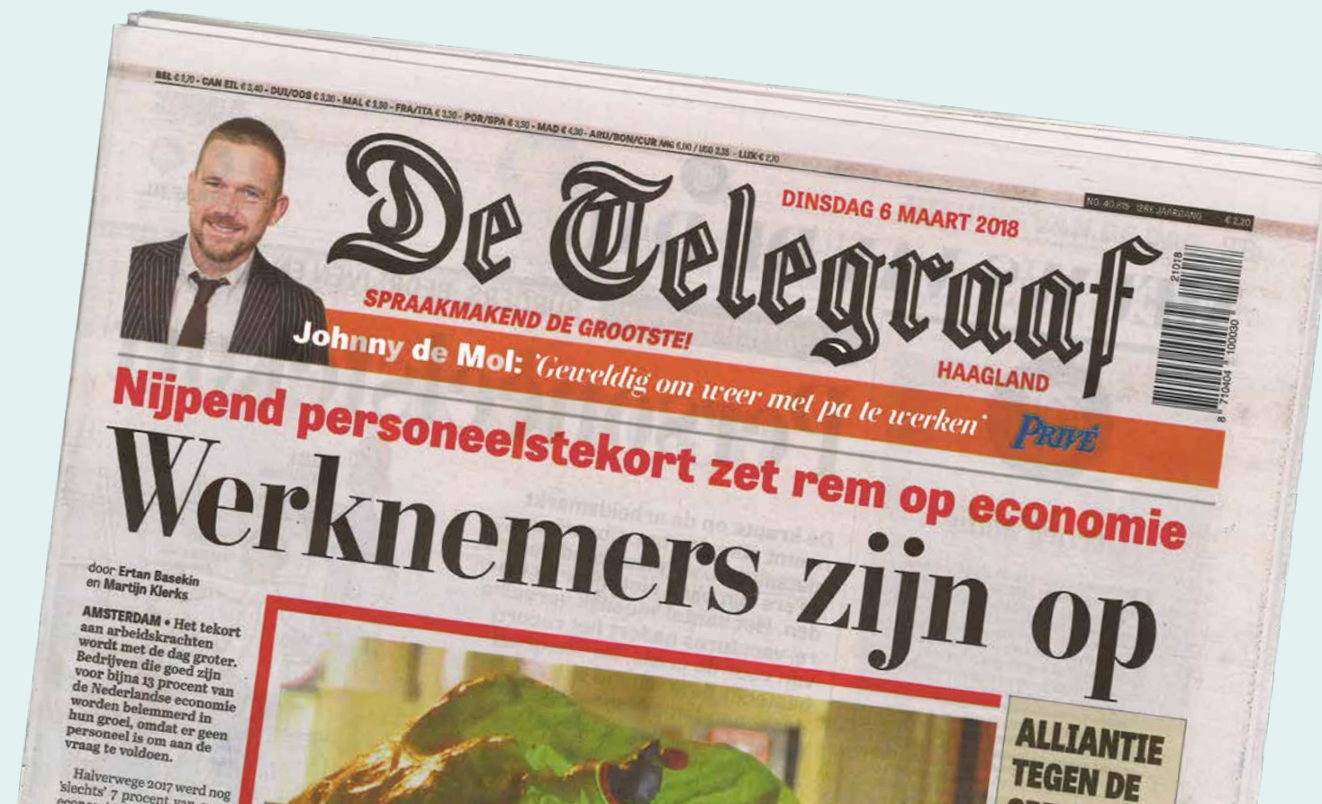
De Telegraaf, 6 maart 2018 Door Ertan Basekin en Martijn Klerks

De krapte op de arbeidsmarkt neemt toe. Het wordt steeds moeilijker om goede vakmensen te vinden én te houden. Het is een taak van werkgevers om personeelsverloop te voorkomen. Daarom is het verstandig medewerkers de ruimte te geven om zich bij- of om te scholen, hun eigen functie vorm te geven en hun talenten te ontwikkelen. De AWWN-app Tiptrack helpt daarbij.