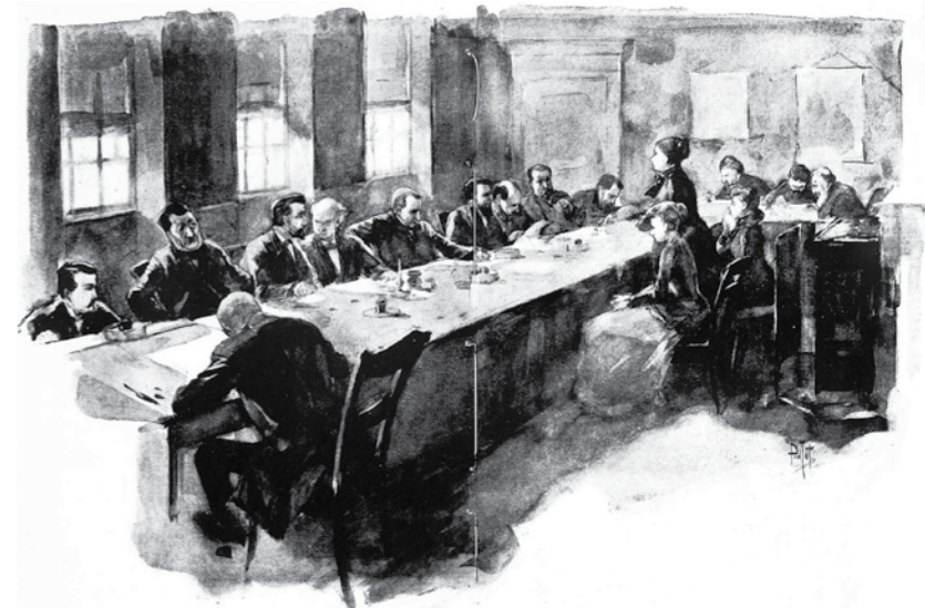
Getuigenverhoor door de commissie.

De arbeidsenquête en staatsenquête bewezen dat misstanden onderwerp van aandacht en zorg waren. In feite waren het de voorboden van verdere sociale wetgeving vanaf 1901.