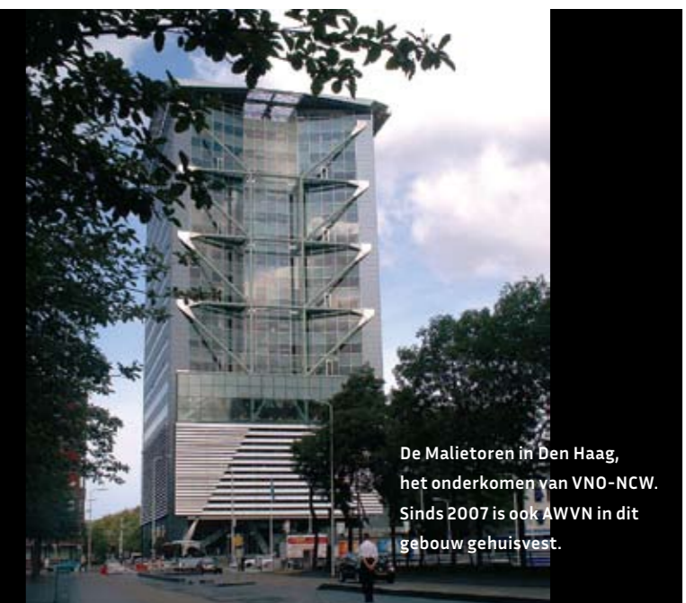
De Malietoren in Den Haag, het onderkomen van VNO-NCW. Sinds 2007 is ook AWVN in dit gebouw gehuisvest.

beide werkgeversorganisaties. Op 23 februari 1995 werden de statuten van de nieuwe organisatie ondertekend. Na de fusie volgde begin 2011 verregaande samenwerking tussen VNO-NCW en MKB-Nederland, waarmee de machtspositie verder werd verstevigd. Waren er tot in de jaren negentig nog zeven centrale ondernemersorganisaties, vanaf 2011 waren dat er de facto nog maar twee: VNO-NCW/MKB en LTO (Land- en Tuinbouworganisatie) Nederland.