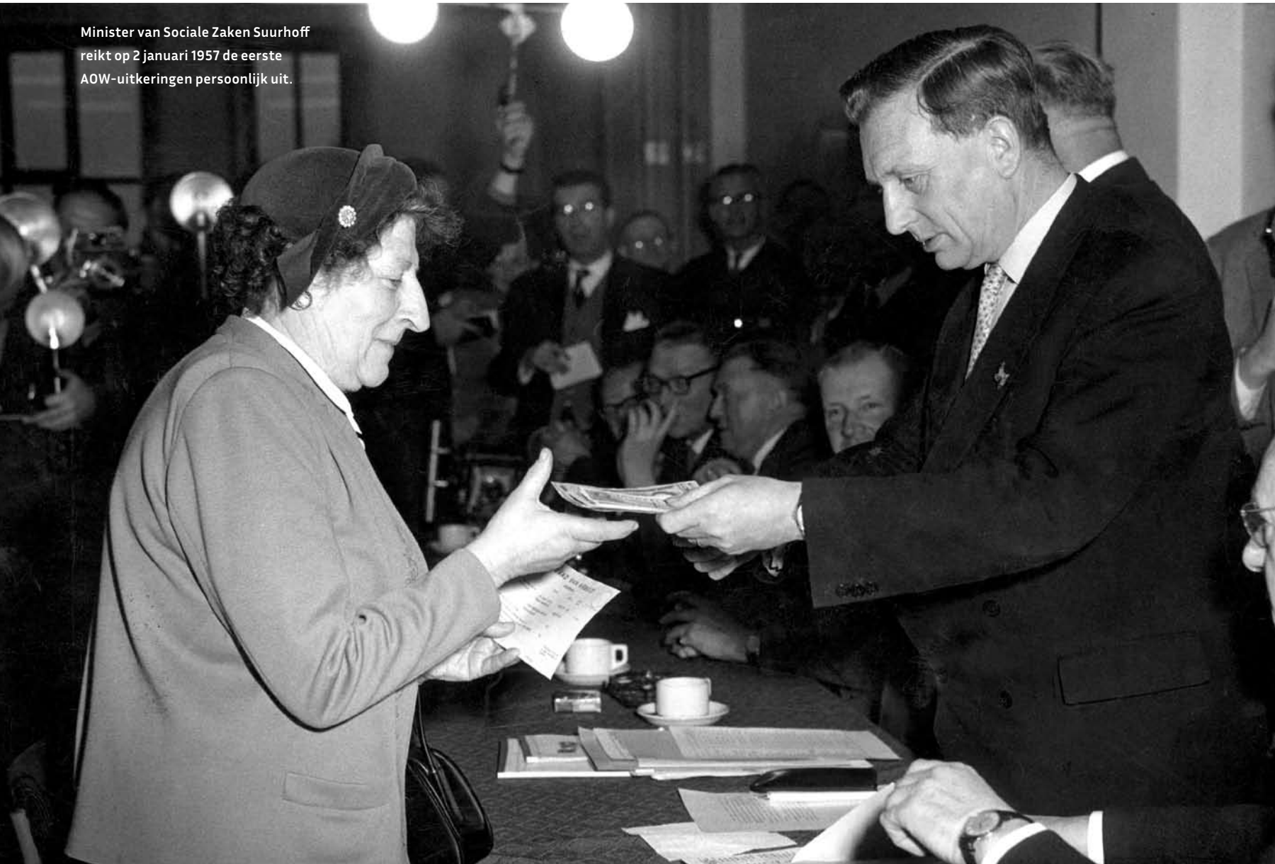
Minister van Sociale Zaken Suurhoff reikt op 2 januari 1957 de eerste AOW-uitkeringen persoonlijk uit.