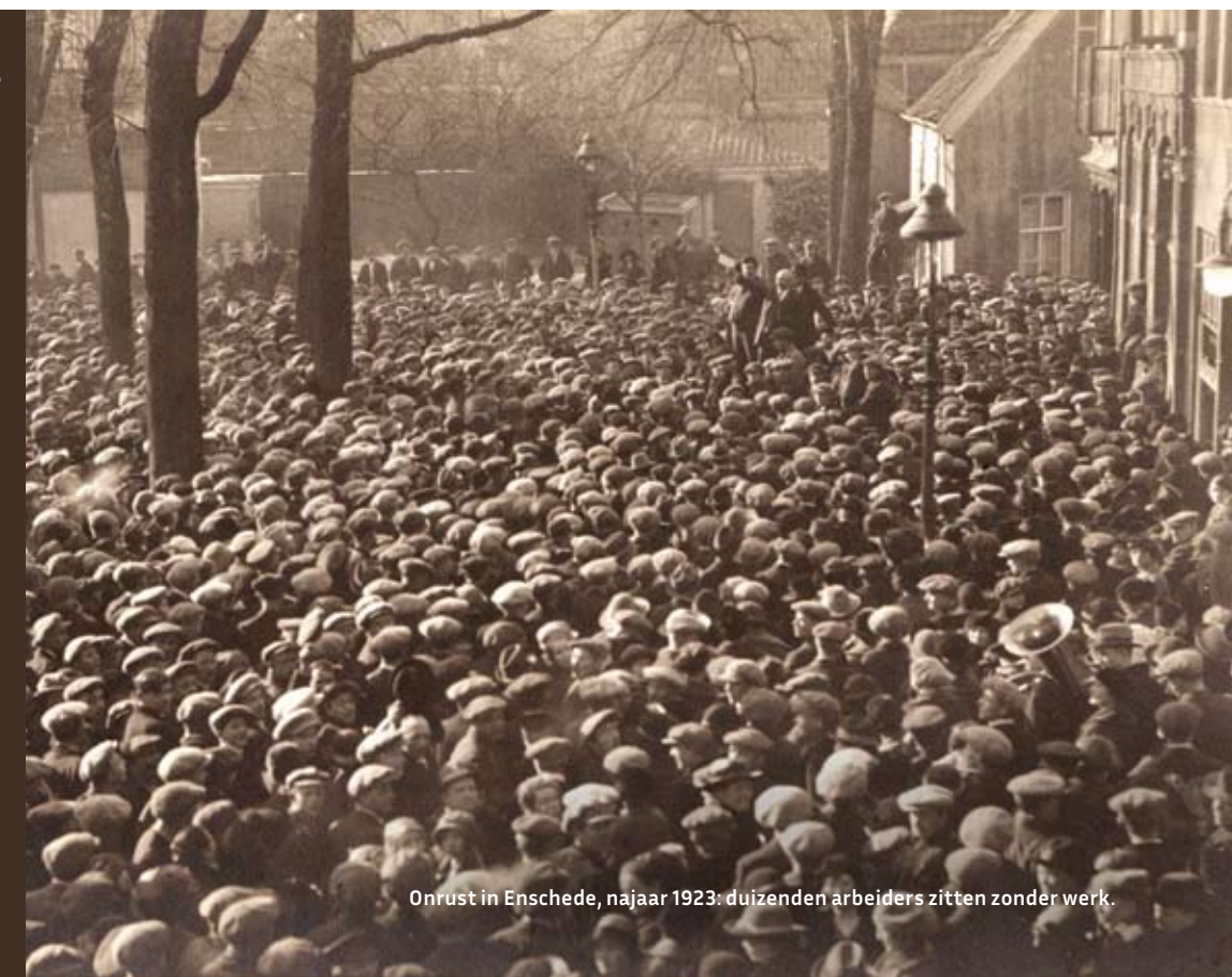
Onrust in Enschede, najaar 1923: duizenden arbeiders zitten zonder werk.

Nadat er in 1888 voor het eerst in de Twentse textielindustrie was gestaakt, richtten de textielbedrijven de 'Fabrikantenvereniging ter voorkoming en bestrijding van stakingen' op. Die hanteerde uitsluiting als wapen. Dat betekende dat als een van de aangesloten bedrijven getroffen werd door een staking, de andere fabrieken de boel stillegden. Arbeiders in die fabrieken konden dan hun werk dus niet doen, en verdienden derhalve niets. Het zogeheten Twentse stelsel bleek een probaat machtsmiddel. Zo sloten in het najaar van 1923 liefst 39 fabrieken in Twente en de Achterhoek de poorten toen er bij Van Heek & Co – arbeiders waren voor de keus gesteld om óf 10 procent minder loon te verdienen óf 10 procent meer te werken – een staking was uitgebroken. Daardoor kwamen 22.000 arbeiders zonder inkomsten te zitten. De stakers kregen weliswaar steun uit het hele land, maar haalden uiteindelijk, na ruim drie maanden strijd, bakzeil.